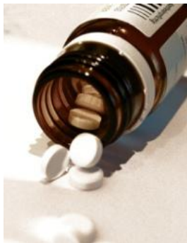
Tip: Een uitgebreide zorgverzekering

Veel gemeenten hebben een collectieve ziektekostenverzekering afgesloten voor hun inwoners met een laag inkomen. Door goede afspraken te maken met de zorgverzekeraar kan een uitgebreide dekking worden aangeboden onder (zeer) gunstige voorwaarden. Een